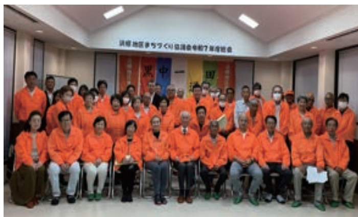
令和7年度 役員・代議員の皆さん