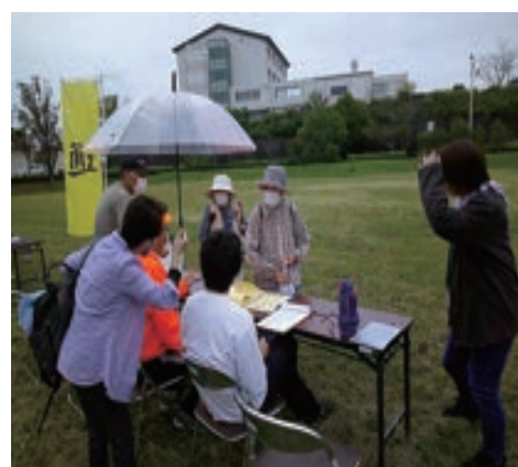
いせトピアまで避難移動