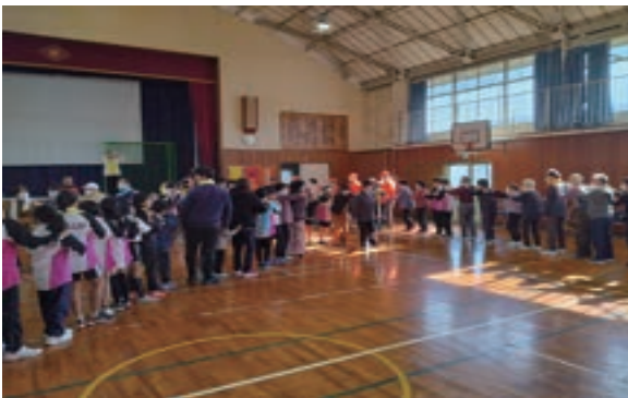
三世代交流ハッピー笑いヨガ

本年も子供の見守り活動の充実として、交通安全啓発のぼり旗「やさしい運動やさしい町」を作成しました。浜郷小学校児童のタウンウォッチング支援として、各班に分かれて危険箇所の説明と交通誘導等しました。年度初めに「自動車の正しい乗り方」啓発チラシを、浜郷小学校、港中学校、倉田山中学校の全児童生徒の皆さんに配布しました。これから住民皆様のご協力をよろしく願います。又、委員の皆様ありがとうございます。