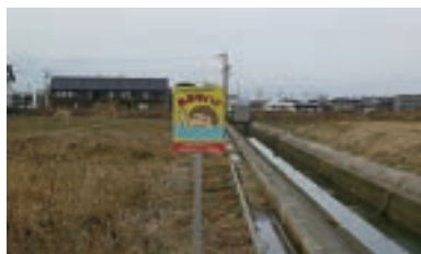
タウンウォッチング立札