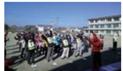
グランドゴルフ大会