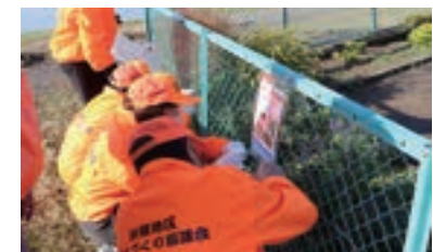
マナーアップ活動