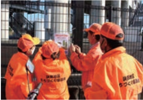
犬のフンマナーアップキャンペーン

あかるくうつくし委員会では、今年も昨年度までの行事を継承、また、パワーアップするために犬のふんマナーアップ365キャンペーンと名前を変えて365日間「毎日がキャンペーンなんだよ」という意識のもと11月17日に浜郷地区5町に分かれてオリジナルポスターの掲示を行い、勢田川の堤防道路24か所に看板の立て替えを実施致しました。犬のふんマナーアップキャンペーンによる成果は年々出てきているように思います。「継続は力なり」という言葉