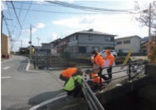
パンダシート張替え

あんしんあんぜん委員会、各町防犯委員会を中心とし、小中学校の先生と両校PTA役員の皆さん15名で活動をしています。主な活動は、毎年タウンウォッチングを行なっています。委員会委員・浜郷小学校先生・PTA役員・伊勢市危機管理課、合わせて26名にて浜郷地区と杜の宮を含めて通学路を中心とした危険箇所の検証を地区別で周りました。チェック項目の確認と新しい危険箇所が無いかならぬと、今年からパンダシートをその場で貼り替え作業を行った。後日、啓発のぼり旗・飛び出しボーイ・危険立上り札等を新設及び破損箇所の交換を行いました。