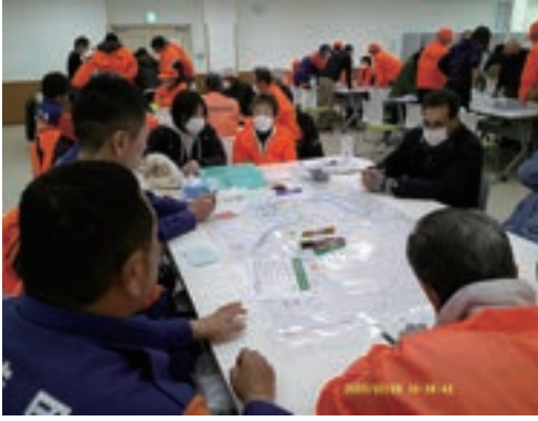
図上訓練対応策検討中