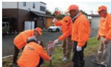
マナーアップ立札を設置