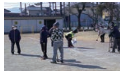
グランドゴルフ大会