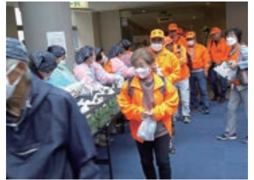
避難訓練、非常食配布