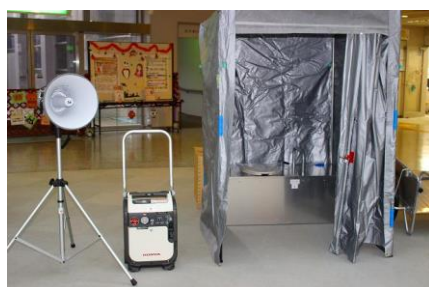
防災資機材（簡易トイレ等）