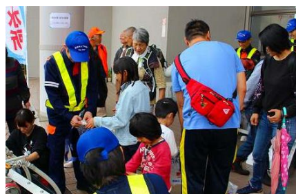
給水車からの受水体験