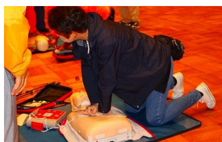
心臓マッサージ体験