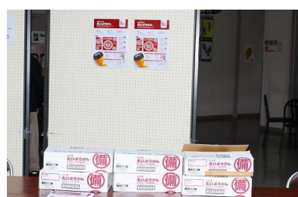
保存食の井村屋「えいようかん」