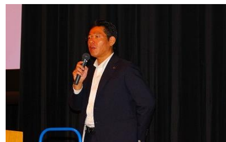
鈴木健一市長ご挨拶