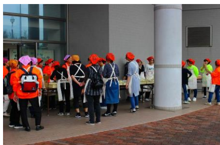
炊き出し班の準備

当日はあいにくの雨となりましたが、浜郷地区内から、高齢者や小さい子供等多くの町民が参加しました。今年は、避難訓練に加え、防災各コーナーを設けて各種体験を行いました。救急コーナーでは心臓マッサージ、消防はしご車での搭乗体験、給水車による受水体験、非常食の飲食体験等多くの体験型訓練でした。加えて、井村屋さんのご支援を受けて「えいようかん」を試食することが出来、大好評でした。（「えいようかん」は、5年間保存可能）