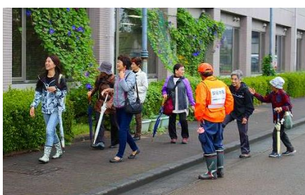
声をかけてみんなで避難