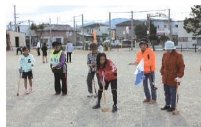
三世代交流・グラウンドゴルフ大会