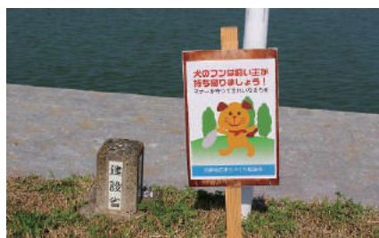
勢田川堤防道路への啓発立札