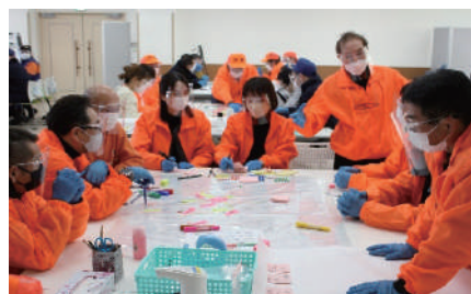
災害図上訓練・各班の討議