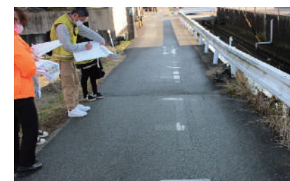
タウンウォッチング