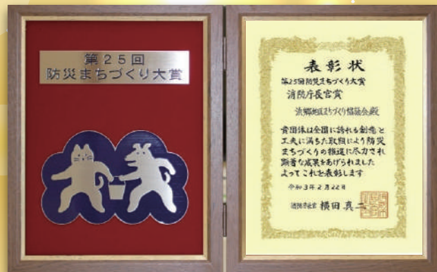
防災のまちづくり大賞消防庁長官賞