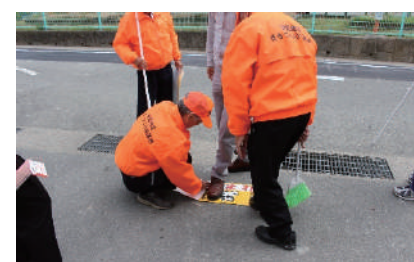
交通安全キャンペーン