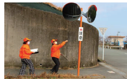
タウンウォッチング

浜郷地区の危険箇所点検のための「タウンウォッチング」、児童の登校見守り活動、交通安全のぼり旗の掲出等及び「交通安全キャンペーン」等を行ってきました。一昨年から浜郷小学校PTAと連携を保ち、通学路を中心とした「タウンウォッチング」を行い、浜郷地区内の危険箇所の点検を行い、「あぶない！」等の看板設置。市などへの要請を行ってきました。