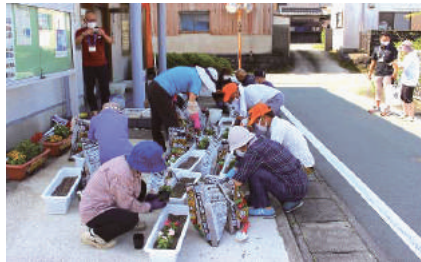
国体協力花いっぱい運動