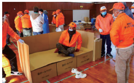
防災資機材設置訓練