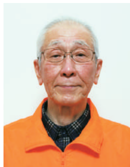
浜郷地区まちづくり協議会