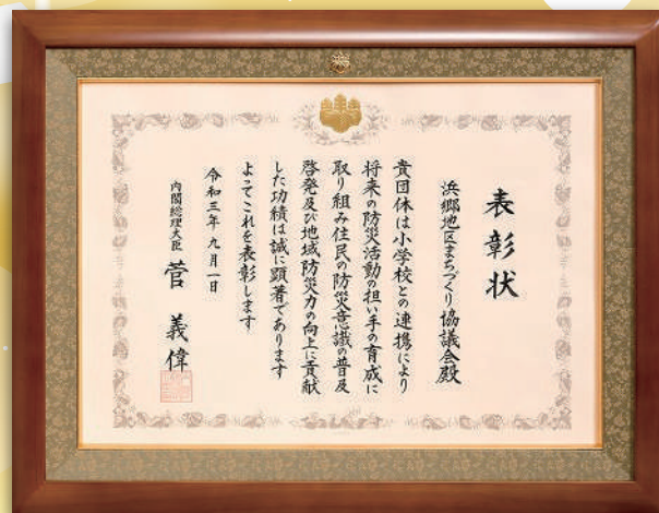
防災功労者内閣総理大臣表彰