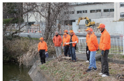
タウンウォッチング（危険箇所検証）

「自分たちで助け合い災害から命を守る」を合言葉に、H25年の設立当初から、防災活動を重点活動に、役員会を防災総合委員会として様々な活動をしてきました。初年度に「防災三ヶ年計画」を策定して計画的に進め、各自治会にて「タウンウォッチング」「防災力向上セミナー」を行い、町民の防災意識を高めて「防災訓練」を実施。その後毎年「防災総合訓練」「災害図上訓練」を実施。さらに浜郷小学校と連携し、6年生児童の「避難所運営ゲームHUG」を実施して防災学習の手助けをしてきました。H28年に「防災マニュアル」（伊勢市で初めての地区防災計画）を発行。本年10周年記念として、「改訂版浜郷地区防災マニュアル」を発行し、全戸配布をします。