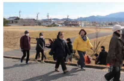
ふれあいウォーキング