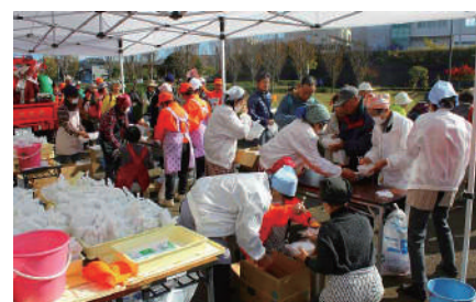
防災総合訓練・炊き出し配膳訓練