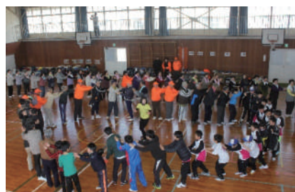
ハッピー笑いヨガ

浜郷地区の皆さんが、元気で健康に暮らせるように、同時にお互いのコミュニケーションを深める事が出来るよう様々な催しを行ってきました。「ハッピー笑いヨガ」「ふれあいウォーキング」「バランスボール」「ウォークラリー」そして高齢者の方々の「グラウンドゴルフ交流太会」等、皆さんに楽しんでいただきました。