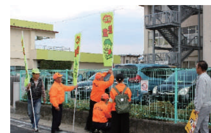
交通安全キャンペーン