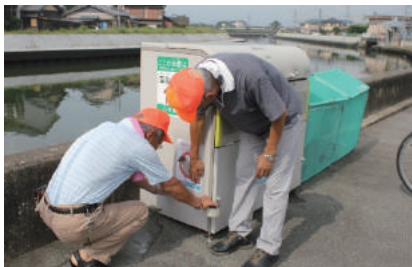
犬の糞マナーアップ