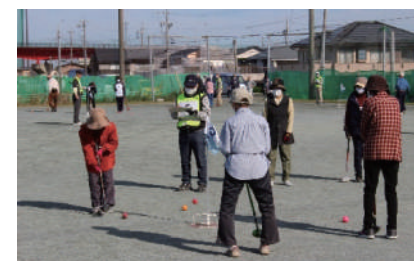
高齢者・グラウンドゴルフ交流大会