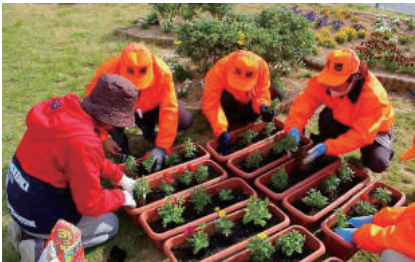
サミット協力花いっぱい運動

めざすまちの姿実現のため、主に2つの事に取り組んできました。一つ目は、勢田川を中心とした散歩道に犬の糞を無くす運動。そのため啓発のポスターを掲出し呼びかけをしてきました。二つ目は、ゴミ問題に取り組み、減量化とゴミ出しマナーアップのための啓発チラシを作成し、全戸配布してきました。また、「伊勢志摩サミット」開催時と、開催中止となったが「とこわか国体」のための花いっぱい運動に協力し、伊勢の環境美化にも取り組んできました。