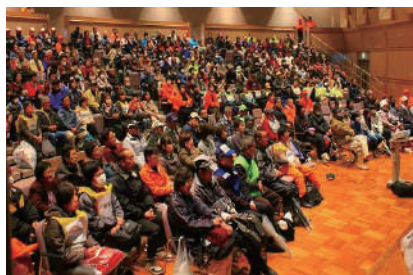
防災総合訓練・講演会