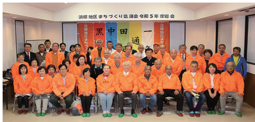
令和5年度 役員・代議員の皆さん

少子高齢化・人口減少が進むなかで、私達の住んでいる浜郷地区に誇りと愛着を持って、心豊かで災害に強い安心・安全なまちづくりに取り組んでいきたいと思います。