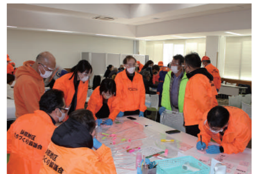
災害図上訓練・各班の討議

石川県能登地方でM6.5の群発地震が発生し震度6強の揺れを観測、その後も余震被害が続いています。5月11日には千葉県南部で震度5強のプレート内部での内陸直下型の地震が発生し、地震活動の活発化が懸念されています。 浜郷地区の令和4年度の防災活動はコロナ禍の訓練となりました。南海トラフ地震を想定し