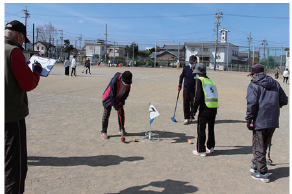
この一打が難しい！

大も無く、3月4日にグラウンドゴルフ大会を開催しました。 開催当日は暖かな日よりとなり、たくさんのご高齢のみなさんに参加いただきました。 競技は実力伯仲。ほとんどの順位が「じゃんけんプレーオフ」で決着、ワイワイガヤガヤのじゃんけん大会表彰式となり、にぎやかな大会となりました。 まるでコロナ禍など無かったような楽しい一日を過ごし、何気ない日常の大切さを改めて痛感しました。 参加いただいた皆様、ご苦労いただいた委員の皆様、ありがとうございました。