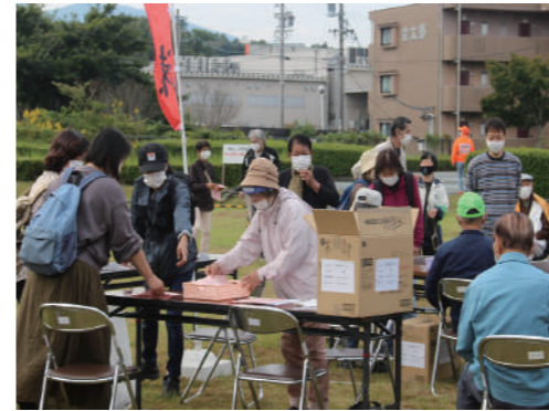
防災訓練・安否確認

浜郷地区まちづくり協議会は、東日本大震災の津波被害の教訓から南海トラフ地震による大津波災害に備えるため、10年間に亘り防災活動に取り組んできました。訓練を通じて「災害を知り、地域を知り、人を知る」活動は、5町の共助の関係強化とともに地域に定着してきたように思います。 さて、令和5年に入り大規模地震が各地で発生しています。2月6日のトルコ・シリア地震は、M7.8の大規模断層破壊による直下型地震で、2000万人以上が被災し数百万人の方が避難生活を送っています。日本では、5月5日に