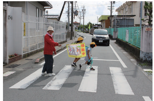
児童見守り活動・気をつけてね

た縦割り班の誘導及び交通危険箇所での見守り等を支援しました。 三つ目は、子どもの見守り活動の充実として、交通安全啓発のぼり旗の掲出「やさしい運転ややさしい町」の町別のぼり旗を本年度も作成しました。 四つ目に、年度初めに「自転車の正しい乗り方」啓発チラシを、浜郷小学校・港中学校・倉田山中学校の全児童生徒の皆さんに配布しました。 地域安全のための活動を、皆さんの協力のもと無事できました。 これからも住民皆様のご協力をよろしく願います。