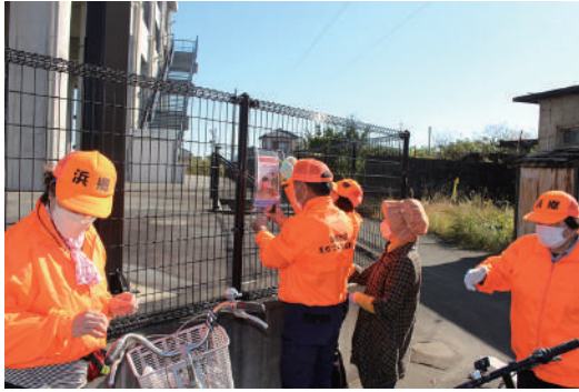
犬のフンマナーアップキャンペーン

立て看板の効果は大きく、堤防道路での犬のフンが随分と少なくなりました。犬のフンマナーアップキャンペーンも年々成果が見えてきてはいます。