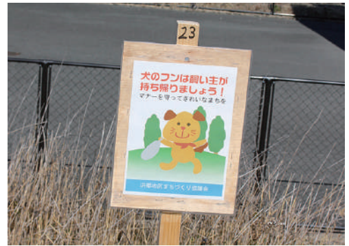
勢田川堤防にも啓発立札

今年も委員会を3回開催いたしました。毎回委員の方からは、活発な意見が交わされました。4回目は出席委員全員で委員会開催を決定したにも拘わらず、開催ができずその後の活動ができませんでした。