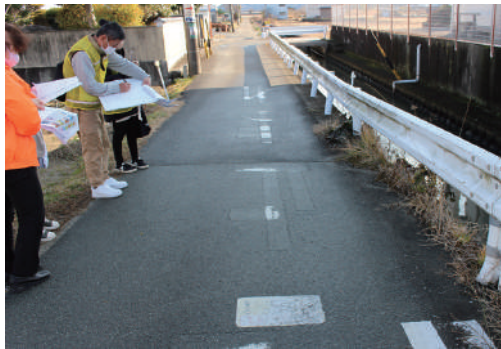
タウンウォッチング 「止まれ」が薄い

あんしんあんぜん委員会は、今年度十七名の委員で四つの活動を行いました。 一つ目は、タウンウォッチングを浜郷小学校・P T A・まち協・伊勢市危機管理課の合同で二年ぶりに行うことが出来ました。一年のチェック事項の確認と新しい危険箇所の気づきを相談しながら廻りました。チェック事項の簡単な処理とし、パンダシートの貼り替え等を行いました。 二つ目は、小学校児童によるタウンウォッチングで、学年を超え