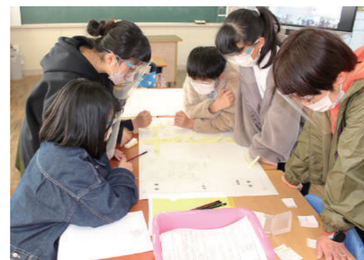
小学生 HUG・班での討議

災害が発生してからでは対応が難しく厳しい。少しでも防災減災に役立ち備えるための行動をとることが必要です。そして、防災活動を通じて地域一体となって助け合う共助活動について考えておくことが求められます。