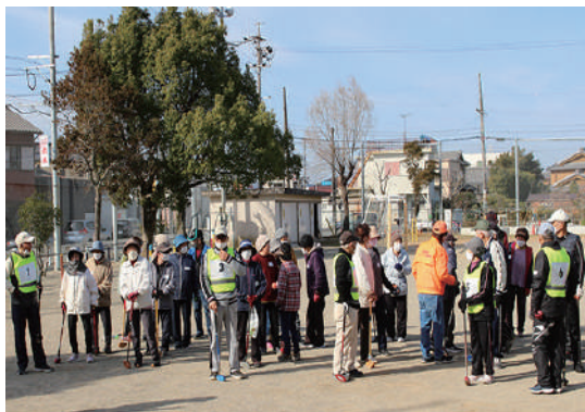
グラウンドゴルフ大会開会式

年度当初、昨年度やむなく中止した「ウォーキング」と「グラウンドゴルフ」の二事業をなんとか開催したいと、秋以降に開催を予定しましたが、第8波の到来により、年内の開催を見送らざるを得ない状況となりました。 10月になり、各町のグラウンドゴルフ活動も徐々に再開されつつあるとのこと、老人会さんから開催希望があるとのこと、春を待ち、3月のグラウンドゴルフ大会開催に向け、準備を進めました。心配していた年末年始の感染拡大